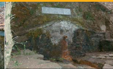
Oratori de Sant Isidre