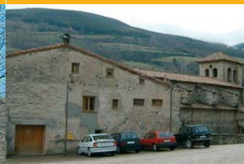
Plaça Les Escoles