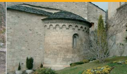
Església de Sant Martí