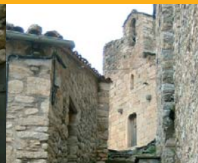
Capella de la Pietat