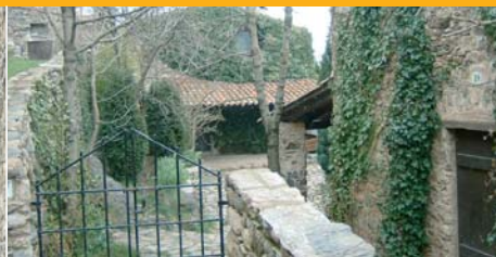
Casa de Joan Ponç