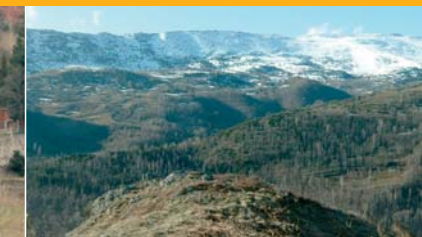
Serra cavallera des del mirador