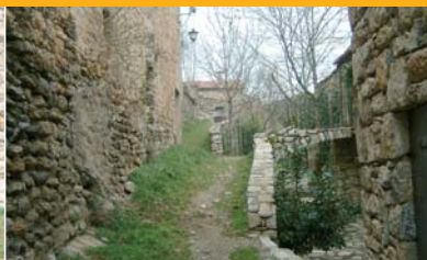
Nucli la Roca