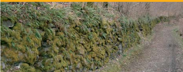
Camí de la Roca