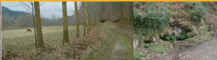
Camí de la Roca