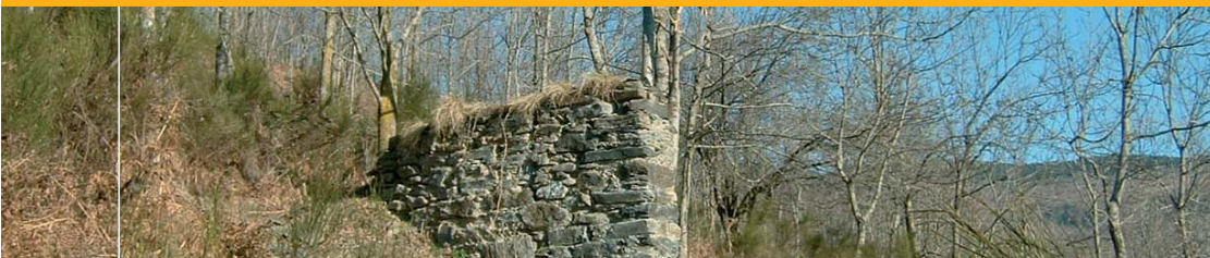
Oratori de Sant Isidre