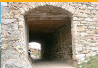
Túnel de l'entrada de la Roca